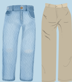
All grades: jeans or any color uniform pants (no holes or rips) NO SKIN SHOWING