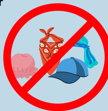
NO SE PUEDEN BUFANDAS, GORROS O SOMBREROS