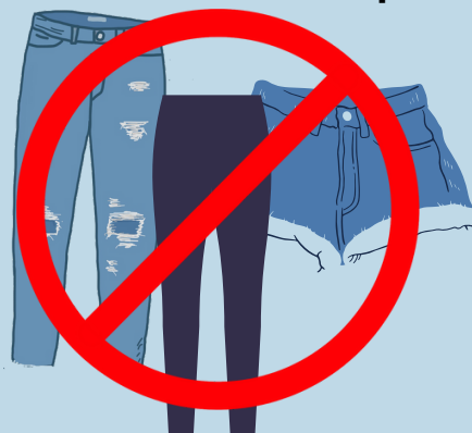
NO JEANS, PANTALONES CORTOS O MEDIAS ROTADAS NO SE MUESTRA LA PIEL