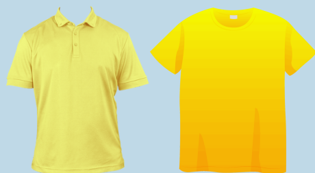
6to grado: camisa amarilla sólida