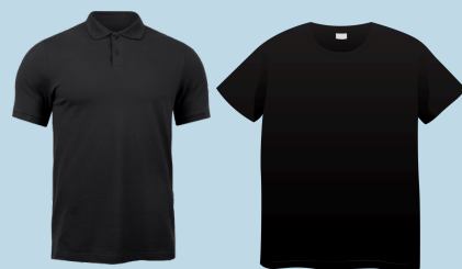
Séptimo grado: camisa negra lisa