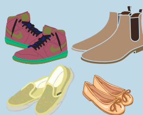
All grades: any color closed-toe sneakers or flats