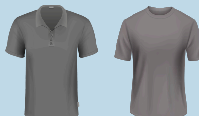
Octavo grado: camisa gris lisa