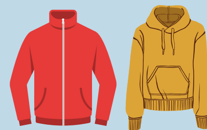
Chaquetas, suéteres y sudaderas con capucha (No se pueden usar capuchas en la cabeza) (no se permiten gráficos ni escrituras ofensivas)