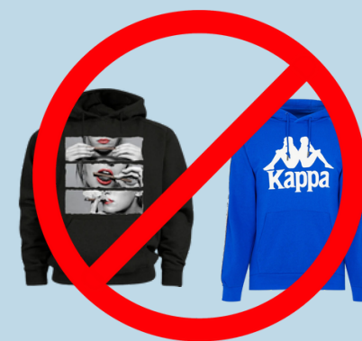
NO HAY GRÁFICOS O ESCRITURAS OFENSIVAS