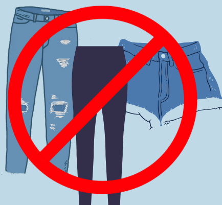
NO RIPPED JEANS, SHORTS, or TIGHTS NO SKIN SHOWING