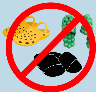
NO CROCS, BUBBLE SLIDES, OR HOUSE SLIPPERS