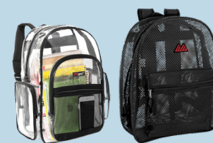
Clear or Mesh Backpacks ONLY