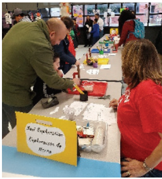
బర్నెట్ ఎలిమెంటరీ స్కూల్లో సైన్స్ వైట్ ఆనందిస్తున్న కుటుంబం.

డేవిడ్ జి. బర్నెట్ ఎలిమెంటరీ స్కూలు ఈస్ట్ సైడ్లో ఉంది మరియు ఈస్ట్ ఎండ్ విద్యార్థులకు 50/50 టూ-వే ఇన్వర్షన్ సెటింగ్లో డ్యూయల్ లాంగ్వేజ్ వాన్ గార్డ్ ప్రోగ్రామ్ను అందించే ఏకైక క్యాంపస్ ఇది. 1926 లో ప్రారంభమైనప్పటి నుండి, బర్నెట్ ఎలిమెంటరీ స్కూలు తన విద్యార్థులందరికీ సాధ్యమైనంత ఉత్తమ విద్యను అందించడానికి నిరంతరం కృషి చేస్తోంది. ఈ రోజు, బర్నెట్ ఎలిమెంటరీ స్కూలులో డ్యూయల్ లాంగ్వేజ్ ప్రోగ్రామ్లో 500 మంది విద్యార్థులు ఉన్నారని మరియు సానుకూల, సంబంధాలను పెంపొందించుకోవడంలో సంబంధిత సమస్య పరిష్కార నైపుణ్యాల ద్వారా కఠినమైన విద్యా కార్యక్రమాన్ని అందించే లక్ష్యాన్ని కలిగి ఉంది.